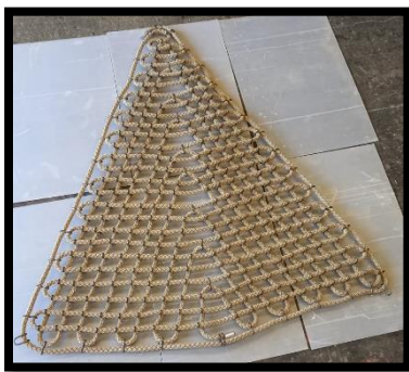
Ausführung mit Seilschleufe oder Seilenden

Verfügbare Standardgrößen: 2.00m x 2.00m x 2.00m 2.50m x 2.50m x 2.50m