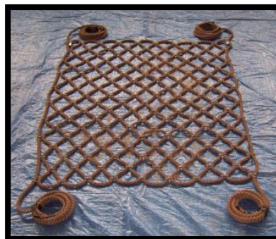
Ausführung mit Seilschleufe oder Seilenden