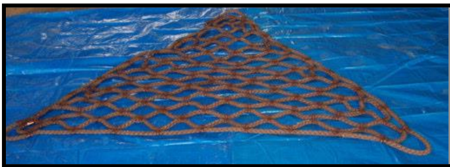
Ausführung mit Seilschlaufe oder Seilenden

Verfügbare Standardgrößen: 1.80m x 2.00m x 2.00m 2.20m x 2.30m x 2.45m 2.50m x 3.30m x 3.30m