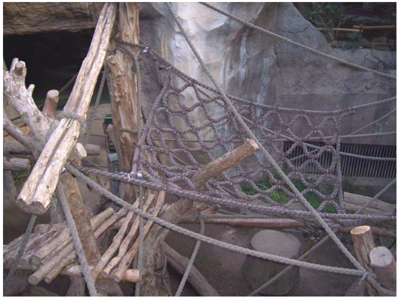
Sonderanfertigungen mit 36 mm Seil im Pongoland Leipzig